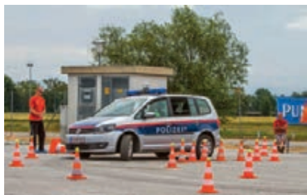
PKW Bewerb, Sektion Kreis