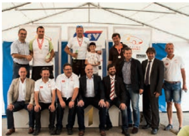
Siegerehrung des Bewerbes: Motorrad Einzelwertung.