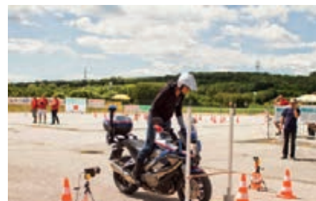
Motorradbewerb, Sektion Trialstopp

Die diesjährigen Bundespolizeimeisterschaften wurden vom Polizei-sportverein Burgenland gemeinsam mit dem Sportverein Cobra/DSE (Direkti-